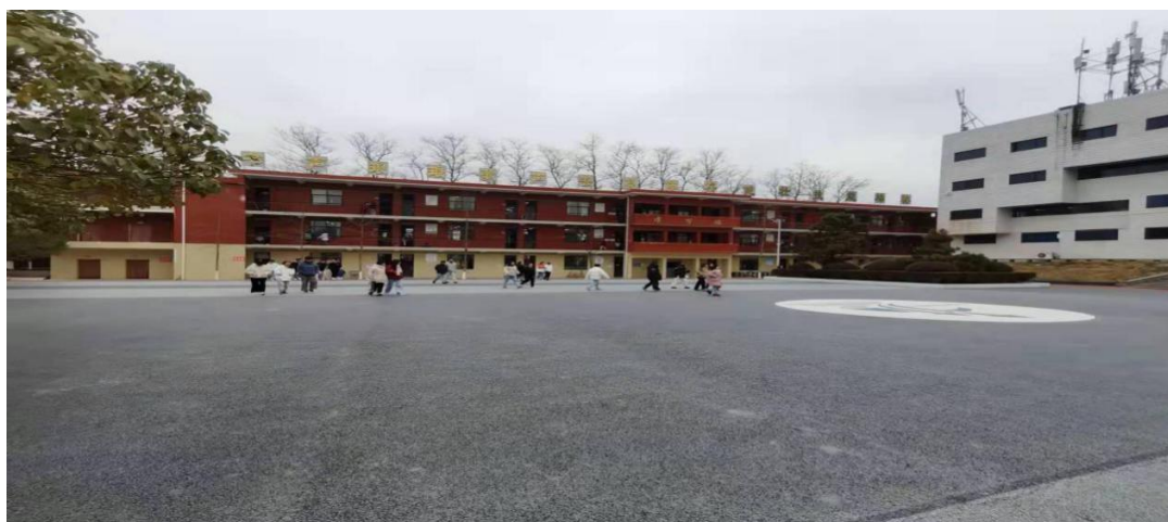
（学校办学 16 字训“书声琅琅、歌声嘹亮、体格健壮、技能棒棒”）

闻人物”评选，树榜样立模范让学生潜移默化受教育。我们特别重视学生外派企业顶岗实习时的国学经典教育效果。2017—2019 年，我们组织专门人员先后到到 15 家年年派遣学生实习的企业考查，调查结果显示：与其他地区来的学生比，企业评价明显高出。我校学生能更很好地与工友谦让有礼相处，更能吃得苦耐劳遵纪守法，很少有其他学校实习生常有的违纪旷工、打架滋事、破坏生产、不服管理等行为，而且企业评价美誉度逐年提高，毕业生很受企业公司的欢迎和管理人员的喜欢。