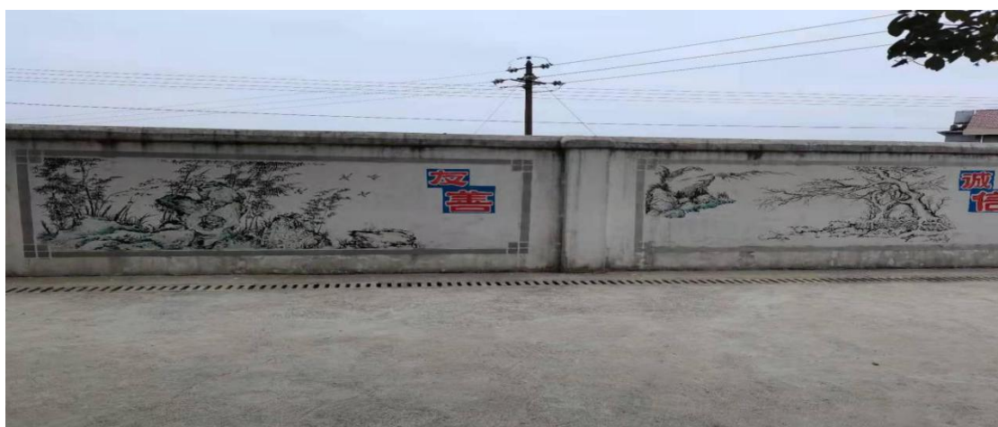
（学校注重国学经典文化熏陶，让学生跟围墙对话动起来）